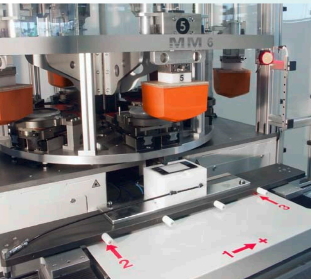
Bild links: Über die Achsen 1, 2 und 3 wird die Position des Werkstückes korrigiert. Zudem erfolgt durch eine gegenläufige Bewegung der Achsen 2 und 3 eine Winkelkorrektur.

Ebenso eignet sich das System für das Bedrucken großer Werkstücke, da verschiedene Positionen angefahren werden können.