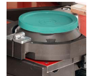
Patentierter MCI-Farbtopf (geschlossenes Farbgebersystem)