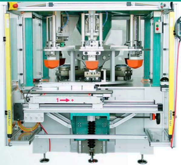
MM6 mit Siemens S7 Steuerung und Schutzhäuser

Auf Wunsch kann die MM6 individuell angepasst werden. Der Einsatzbereich des zuverlässigen Drucksystems ist somit nicht nur der klassische Handarbeitsplatz . Vor allem eine Integration in Automationen ist mit der MM6 perfekt realisierbar.