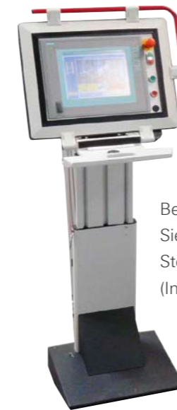
Bedienpanel Siemens S7 Steuerung (Industrie-PC)