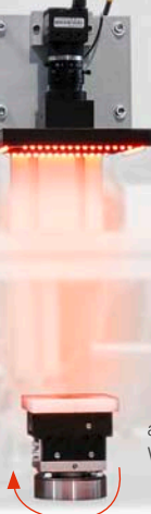
automatisch drehende Werkstückaufnahme